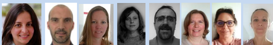
Photo des parents élus en 2019 / 2020 sur l'école

Réunion d'échanges ouverte à tous les parents, nous vous y présenterons la FCPE, le fonctionnement des conseils d'école et du périscolaire sur les écoles de la ville.